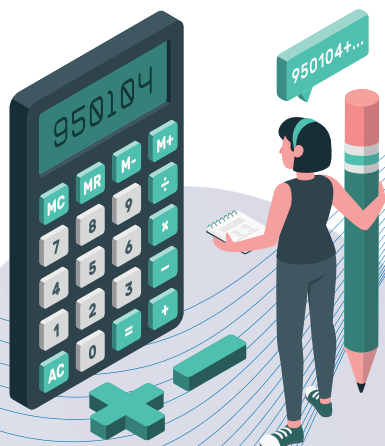
Resultado da economia mensal/anual